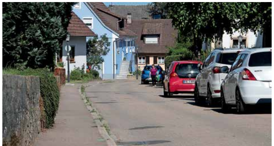
Viel diskutiert ist der erste Bauabschnitt der Lindenstraße in Niederweiler. Es geht um den Umgang mit dem Verkehr und die Sicherstellung von Gehwegen in einem engen Straßenraum.

In den beiden ersten Bauabschnitten sieht der Planer eine Pflasterung des gesamten Straßen- und Gehwegbereichs vor. Im Uferbereich des Klemmbachs sollen Stufen und Sitzsteine geschaffen werden – in Absprache mit der Unteren Wasserbehörde. Die Versorgungsleitungen sollen nicht mehr durch das Bachbett geführt werden, sondern an der dritten Brücke hinter Elektro Kruse angehängt werden. Diese Brücke wird aus statischen Gründen voraussichtlich abgelastet.