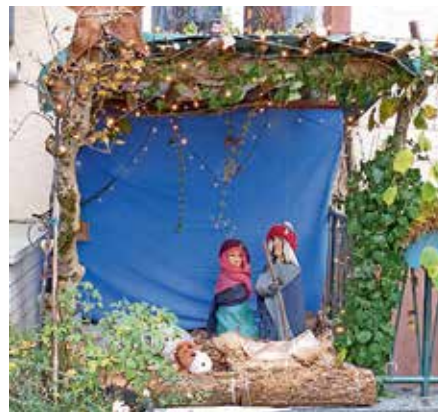
Krippe, von Herrn Moritz Krause mit Materialien aus der Natur gebaut!