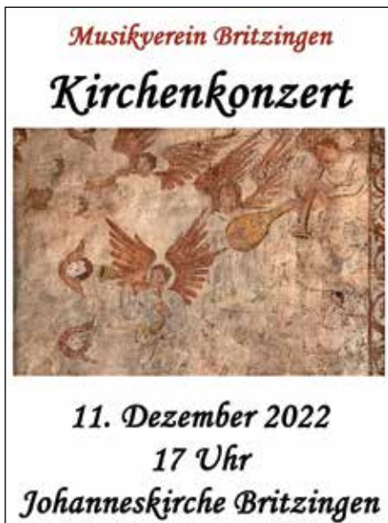
Kirchenkonzert 2022 Britzingen